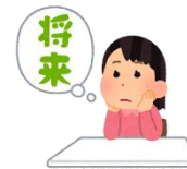
就労など将来の相談

※ 受診歴や障がい児・者手帳がなくても相談できますので、お気軽にご連絡ください。