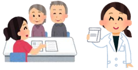
健康に関する相談