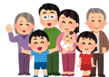
家族・家庭に関する相談