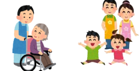
福祉サービスの相談